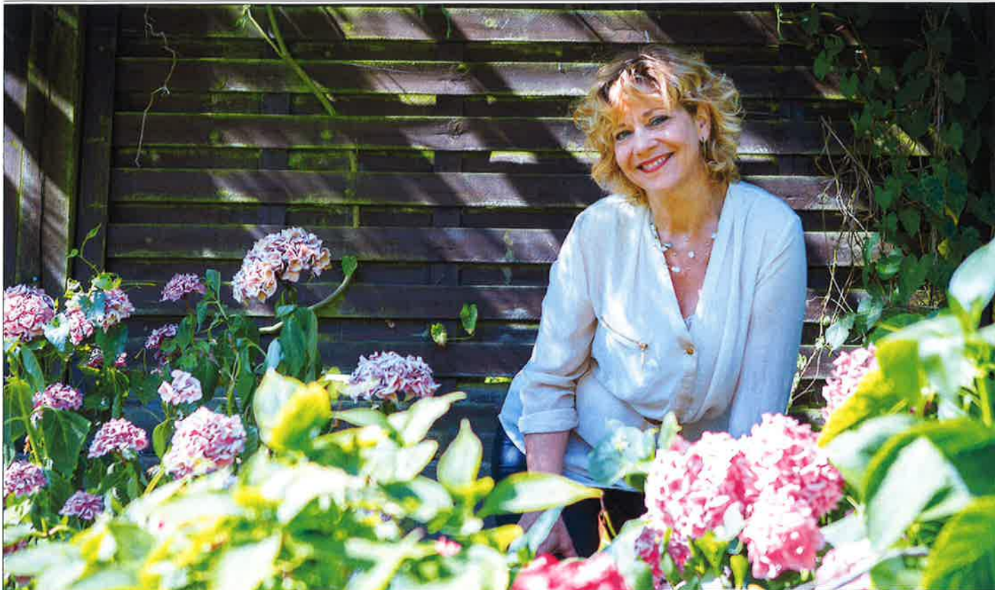
Højdepunkter i den eventyrteater-lige karriere indebærer også kåringen som årets Dirch; vinder af en sonetkonkurrence på Det Kongelige Teater; den dag, hun stod med sin første bog i hånden, da hun vandt en Danish Music Award for en sang til Birthe Kjær - og da hun blev spurgt, om hun ville skrive lejlighedsange til kongehuset.